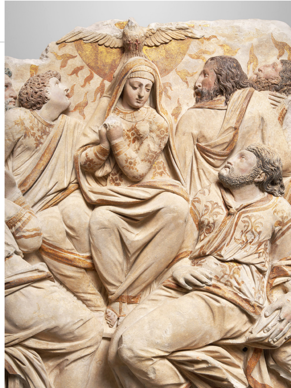
La Pentecôte, jubé de l'abbaye de Sainte-Geneviève (détail), milieu du 16 e siècle, polychromie du 19 e siècle, musée du Louvre

Au Louvre, elle s'occupe des sculptures du 15 e et du 16 e siècle pour la France et l'Europe du Nord et mène une importante campagne de restauration des sculptures françaises de cette époque. Elle participe aux programmes de recherche et aux actions de mise en valeur (expositions, colloques, publications...) dans ces domaines. Elle a contribué à l'ouvrage que Pierre-Yves Le Pogam a consacré à La sculpture gothique, 1140-1430 (Hazan, 2020). Elle poursuit ses travaux sur la sculpture bourguignonne de la fin du Moyen Âge et participe au commissariat de l'exposition « Miroir du Prince.